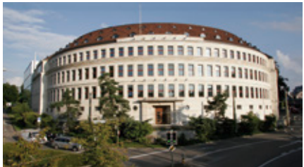
ZHAW School of Management and Law

Zürcher Hochschule für Angewandte Wissenschaften ZHAW School of Management and Law St.-Georgen-Platz 2 Postfach 958 8401 Winterthur www.zhaw.ch